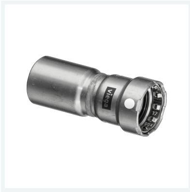
Megapress S-Reduzierstück mit SC-Contur Modell 4315.1 Artikel 799 328