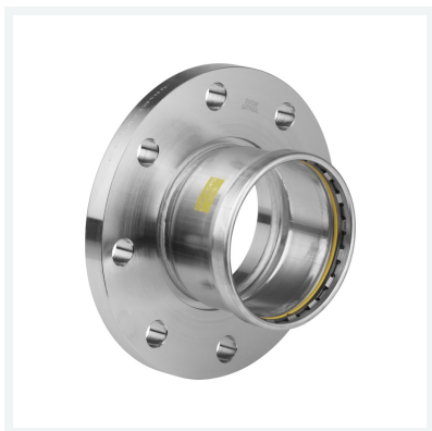
Sanpress Inox G XL-Flanschübergang mit SC-Contur Modell 0259XL Artikel 578 510