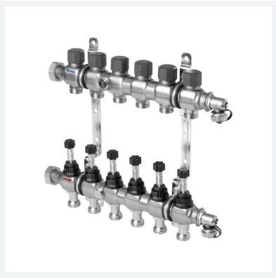
Heizkreisverteiler DN25 Modell 1010 Artikel 786 878