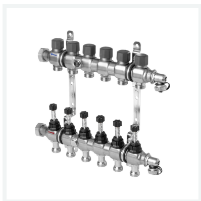
Heizkreisverteiler DN25 Modell 1010 Artikel 786 908