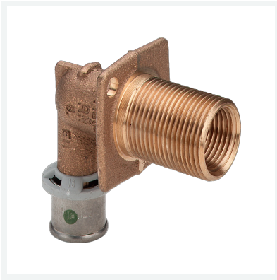
Sanfix P-Wanddurchführung mit SC-Contur Modell 2132.1 Artikel 303 952