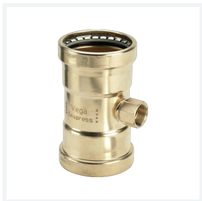
Seapress XL-T-Stück Modell 0317.2XL Artikel 453 770