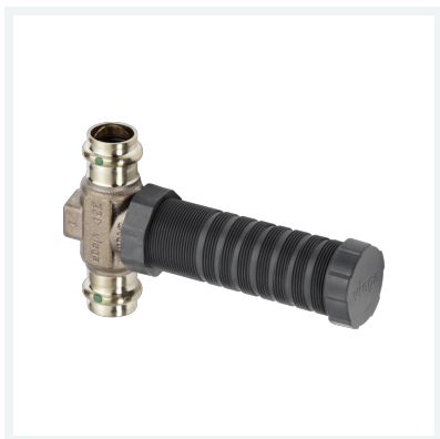
Easytop-UP-Geradsitzventil mit SC-Contur Modell 2235.2 Artikel 755 607