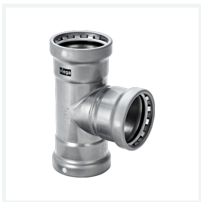
Megapress S XL-T-Stück mit SC-Contur Modell 4218XL Artikel 751 982