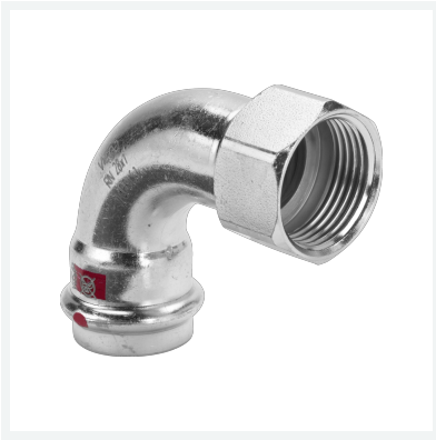
Prestabo-Übergangsbogen 90° mit SC-Contur Modell 1114.5 Artikel 704 650