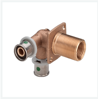
Sanfix P-Doppelwanddurchführung mit SC-Contur Modell 2132.4 Artikel 304 102