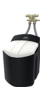
Abb.: SOFTwell K