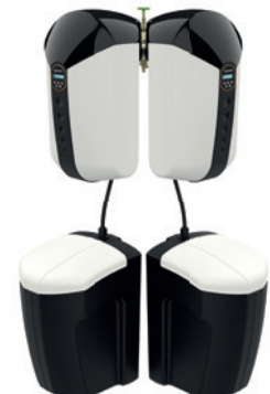
Abb.: SOFTwell P MEGA

JU-Control* – Eine App, viele Möglichkeiten: Informieren Sie sich über alle wichtigen Betriebszustände und rufen Sie relevante Daten ab. Lesen Sie Mitteilungen Ihrer Geräte über wichtige Ereignisse – als Push-Nachricht, E-Mail oder SMS.