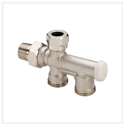
Heizkörperanschlussstück Modell 1069.2 Artikel 110 475