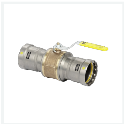
Megapress G-Gaskugelhahn Megapress G-Pressanschlüsse mit SC-Contur Modell 4675 Artikel 801 519