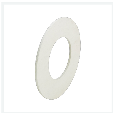
Dichtung Modell 2259.9