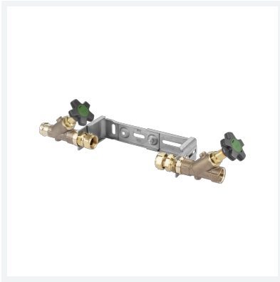
Easytop-Montageeinheit mit SC-Contur Modell 2230.12 Artikel 629 878