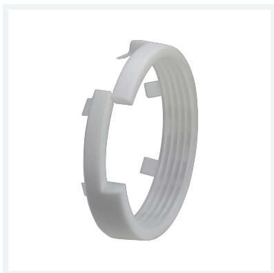
Geopress-Klemmring Modell 9615.8