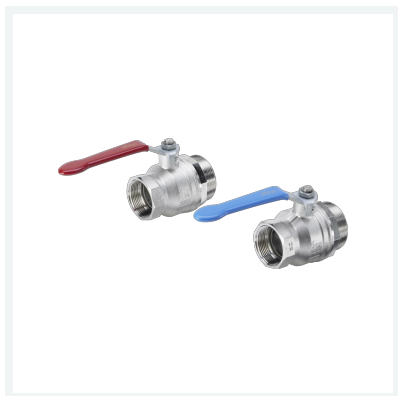
Kugelhahnset Modell 1041.2 Artikel 696 085