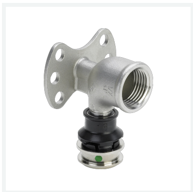
Raxinox-Wandscheibe mit SC-Contur - Pressanschluss, Rp-Gewinde Modell 4425.5