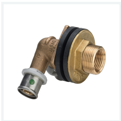
Sanfix P-Doppelwanddurchführung mit SC-Contur Modell 2132.41 Artikel 310 769