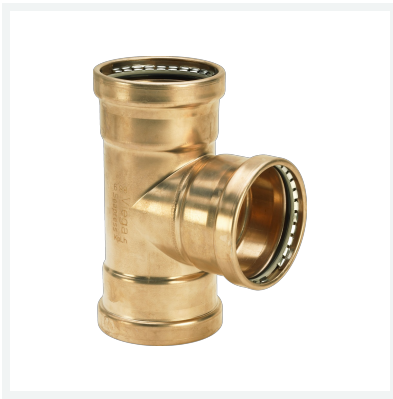
Seapress XL-T-Stück Modell 0318XL Artikel 453 879