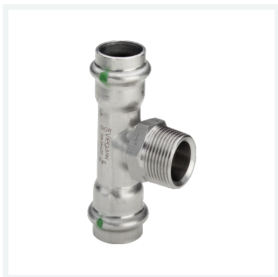
Sanpress Inox-T-Stück mit SC-Contur Modell 2317.1 Artikel 446 000