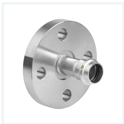
Sanpress Inox-Flanschübergang mit SC-Contur Modell 2359 Artikel 593 339