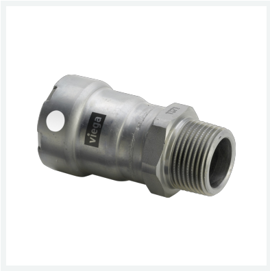
Megapress S-Übergangsstück mit SC-Contur Modell 4311 Artikel 769 598