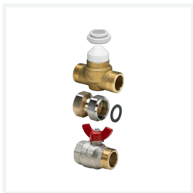
Zonenventilset Durchgang Modell 1286 Artikel 610 005