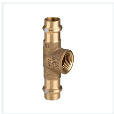
Profipress S-T-Stück mit SC-Contur Modell 4517.2 Artikel 628 673