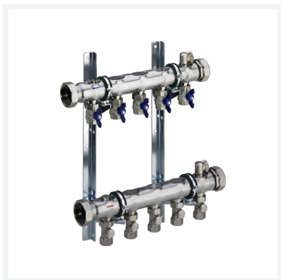
Industrierverteiler DN40 Modell 1007 Artikel 621 988