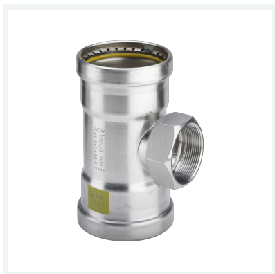
Sanpress Inox G XL-T-Stück mit SC-Contur Modell 0217.2XL Artikel 578 497