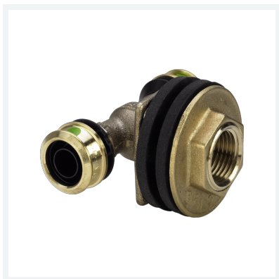
Raxofix-Doppelwanddurchführung mit SC-Contur Modell 5332.81 Artikel 647 735