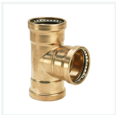
Seapress XL-T-Stück Modell 0318XL Artikel 453 794