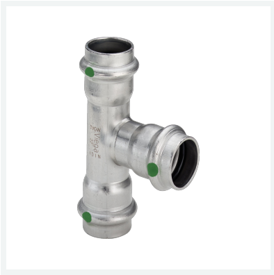
Sanpress Inox-T-Stück mit SC-Contur Modell 2318 Artikel 435 851