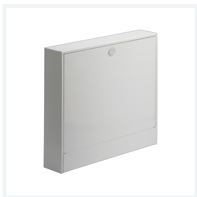
AP-Verteilerschrank Modell 1294.1 Artikel 610 333