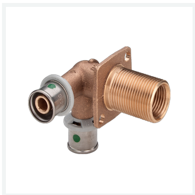
Sanfix P-Doppelwanddurchführung mit SC-Contur Modell 2132.4 Artikel 304 096