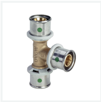
Sanfix P-T-Stück mit SC-Contur Modell 2118 Artikel 566 722