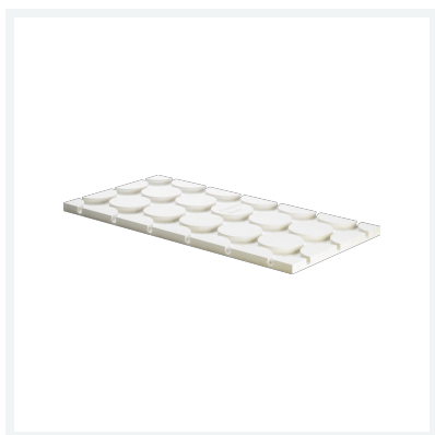
Fonterra Reno-Kopfplatte - für Trockenfußbodenheizung Modell 1238.11