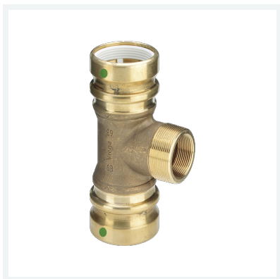
Geopress-T-Stück mit SC-Contur Modell 9617.1TW Artikel 767 211