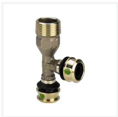
Raxofix-T-Stück mit SC-Contur Modell 5326.4 Artikel 647 643