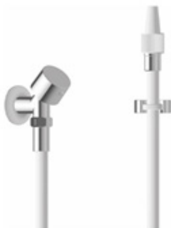
Kneipp Garnitur für Blitzguss mit Eckabsperrventil - DN15 oder DN20

CONTI+ Hydrotherapie-Garnituren für Ihre Gesundheit aktiv im Einsatz.