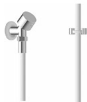
Kneipp Garnitur mit Eckabsperrrventil - DN15 oder DN20