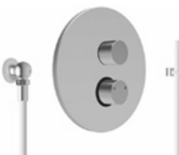
Kneipp Garnitur Unterputz DN20 - mit integrierten Absperrventil - mit Verbrühschutz - Möglichkeit zur thermischen Desinfektion