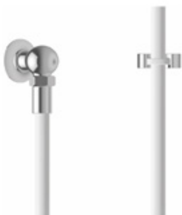
Kneipp Garnitur mit Kugelanschlussstück - DN15 oder DN20

Kneipp Guss Garnituren für Temperaturwechselanwendungen