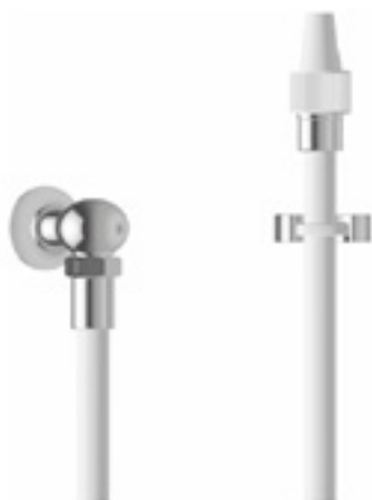
Kneipp Garnitur für Blitzguss mit Kugelanschlussstück - DN15 oder DN20

Kneipp Blitz-Guss Garnituren für Temperaturwechselanwendungen und mechanischen Reiz durch Druckdüse.