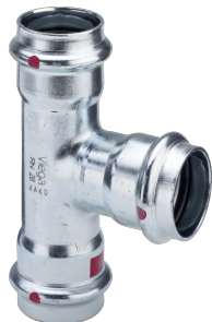
Prestabo-T-Stück mit SC-Contur - Pressanschlüsse Ausstattung Dichtelemente EPDM Modell 1118 Artikel 642 556