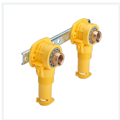
Sanfix P-Montageeinheit mit SC-Contur Modell 2121.01 Artikel 302 818