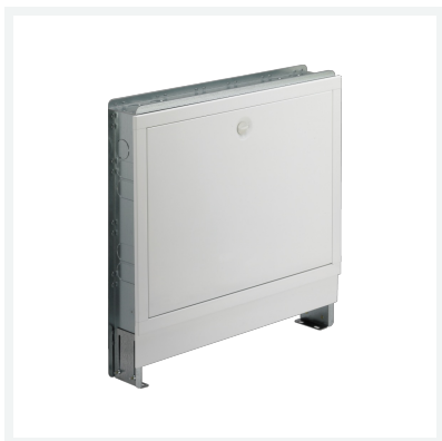
UP-Verteilerschrank Einbautiefe von 110–150 mm Modell 1294 Artikel 610 289