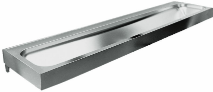
SteelTec Waschrinne Fjord 1800 für Wandmontage

SteelTec Waschrinne Fjord 1800, ohne Überlauf, ohne Hahnloch, Wandmontage, mit Ablg., Edelstahl matt