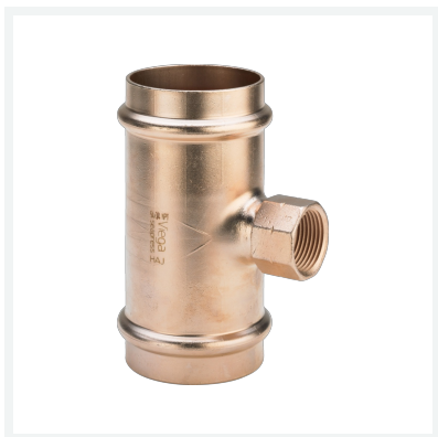
Seapress-T-Stück Modell 0317.5 Artikel 461 096