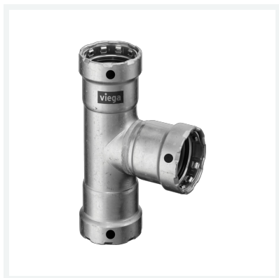
Megapress-T-Stück mit SC-Contur Modell 4218 Artikel 695 088