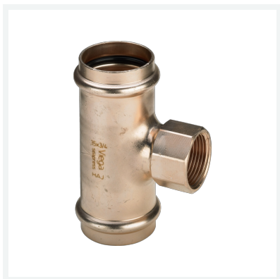
Seapress-T-Stück Modell 0317.2 Artikel 453 749