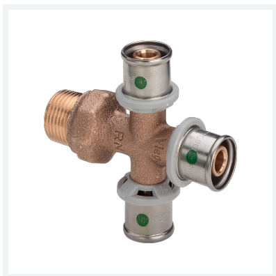
Sanfix P-Kreuzstück mit SC-Contur Modell 2118.9 Artikel 302 740