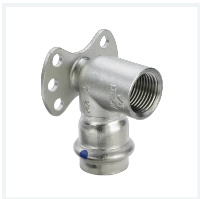
Sanpress Inox LF-Wandscheibe mit SC-Contur labs-frei (Einzelverpackung) Modell 2325.5LF Artikel 667 108