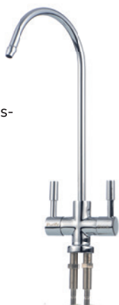
2-Wege-Zapfhahn für gefiltertes sowie reines Wasser

JUDO Bioquell®-PURE stellt eine zuverlässige Versorgung mit sauberem, klarem und geruchlosem Trinkwasser sicher. Das System benötigt keinen zusätzlichen Lagertank, ist daher besonders platzsparend und sorgt für einen stagnationsfreien hygienischen Betrieb. Die Filter lassen sich durch das Schnellverschlusssystem ganz einfach wechseln. Das Untertisch-System eignet sich für die Behandlung von klarem, farblosem, eisen- und manganfreiem Trinkwasser.