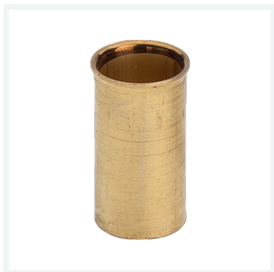
Stützhülse Modell 1023