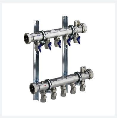
Industrieverteiler DN40 Modell 1007 Artikel 620 837