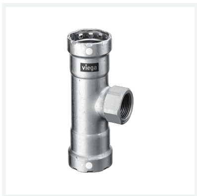
Megapress S-T-Stück mit SC-Contur Modell 4317.2 Artikel 770 327